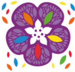
Juegos Florales Escolares Nacionales