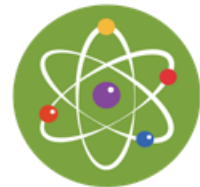
Feria Escolar Nacional de Ciencia y Tecnología "Eureka"

Dirección General de Educación Básica Regular Dirección de Educación Física y Deporte