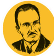
Premio Nacional de Narrativa y Ensayo "José María Arguedas"