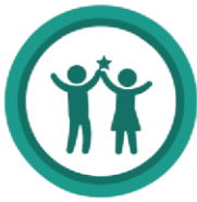
Concurso Nacional Crea y Emprende