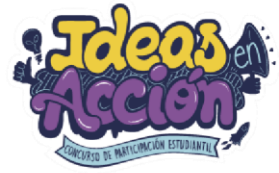
Concurso de Reconocimiento a la Participación Estudiantil Ideas en Acción