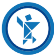
Olimpiada Nacional Escolar de Matemática