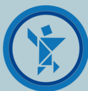
Olimpiada Nacional Escolar de Matemática