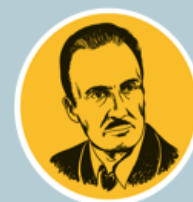
Premio Nacional de Narrativa y Ensayo "José María Arguedas"

Dirección General de Educación Básica Regular Dirección de Educación Física y Deporte Dirección de Educación Secundaria 2022