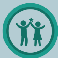
Concurso Nacional Crea y Emprende