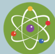
Feria Escolar Nacional de Ciencia y Tecnología "Eureka"