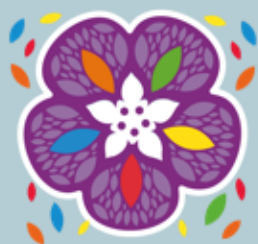
Juegos Florales Escolares Nacionales