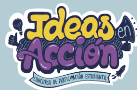
Concurso de Reconocimiento a la Participación Estudiantil Ideas en Acción